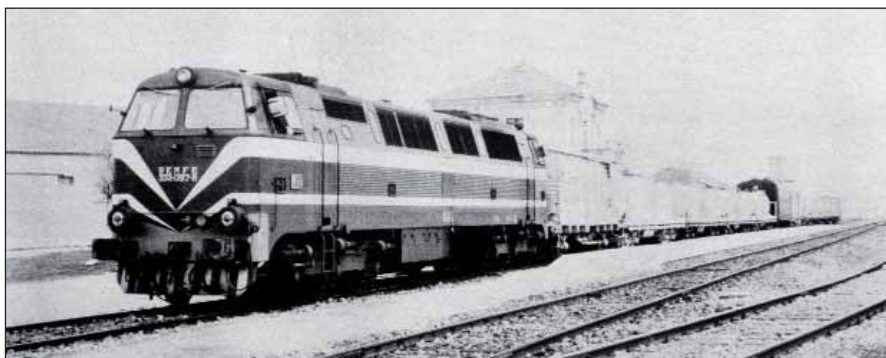
Un tren herbicida entre Ávila y Salamanca.

forma de librar a las ciudades de los agobios circulatorios.