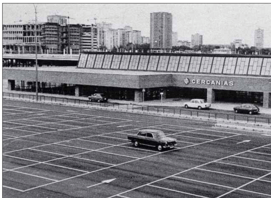
Inaugurada la estación de cercanías de Chamartín.

El 15 de junio Adolfo Suárez gana las primeras elecciones libres celebradas en España tras el franquismo. Le sigue el PSOE, con Felipe González como secretario general, el Partido Comunista de Santiago Carrillo y Alianza Popular, liderada por Manuel Fraga . España avanza hacia la democracia pero su situación económica es mala. Los "Pactos de la Moncloa" tratarán de poner fin a la recesión económica y aproximarse al nivel de los países europeos.